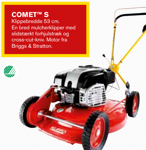
COMET™ S Klippebredde 53 cm. En bred mulcherklipper med slidstærkt forhjulstræk og cross-cut-kniv. Motor fra Briggs & Stratton.