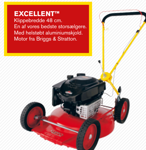
EXCELLENT™ Klippebredde 48 cm. En af vores bedste storsælgere. Med helstøbt aluminiumskjold. Motor fra Briggs & Stratton.