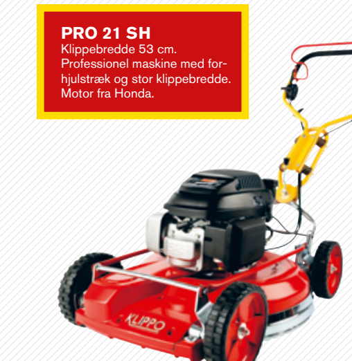
PRO 21 SH Klippebredde 53 cm. Professionel maskine med forhjulstræk og stor klippebredde. Motor fra Honda.