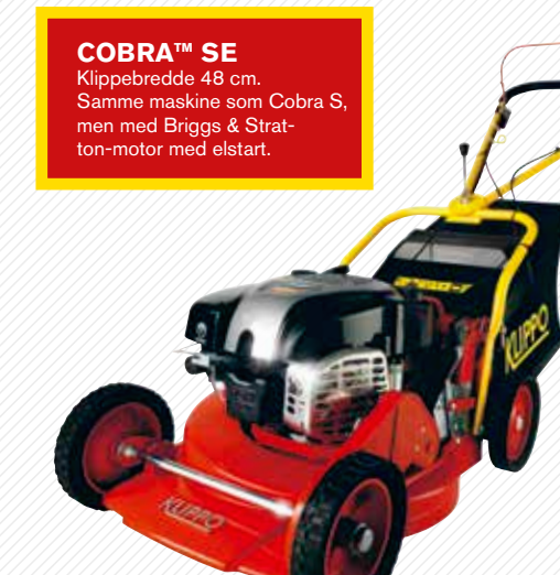
COBRA™ SE Klippebredde 48 cm. Samme maskine som Cobra S, men med Briggs & Stratton-motor med elstart.