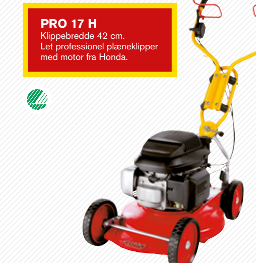
PRO 17 H Klippebredde 42 cm. Let professionel plæneklipper med motor fra Honda.