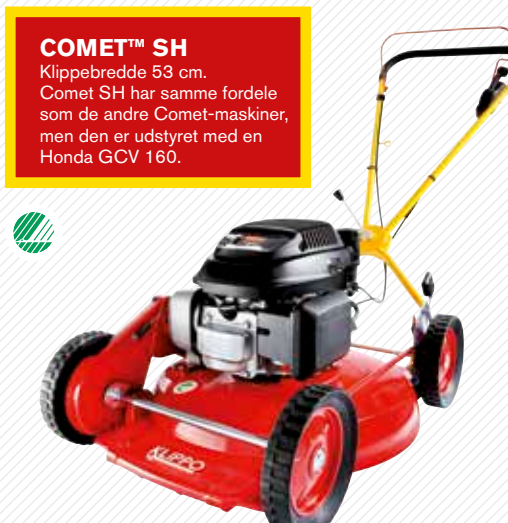
COMET™ SH Klippebredde 53 cm. Comet SH har samme fordele som de andre Comet-maskiner, men den er udstyret med en Honda GCV 160.