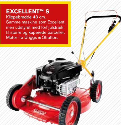
EXCELLENT™ S Klippebredde 48 cm. Samme maskine som Excellent, men udstyret med forhjulstræk til større og kuperede parceller. Motor fra Briggs & Stratton.