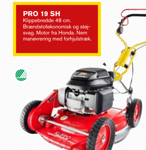
PRO 19 SH Klippebredde 48 cm. Brændstoføkonomisk og støjsvag. Motor fra Honda. Nem manøvrering med forhjulstræk.