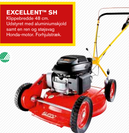
EXCELLENT™ SH Klippebredde 48 cm. Udstyret med aluminiumskjold samt en ren og støjsvag Honda-motor. Forhjulstræk.