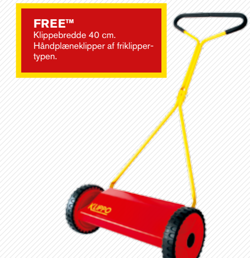
FREE™ Klippebredde 40 cm. Håndplæneklipper af friklipper-typen.