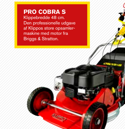
PRO COBRA S Klippebredde 48 cm. Den professionelle udgave af Klippos store opsamlersmaskine med motor fra Briggs & Stratton.