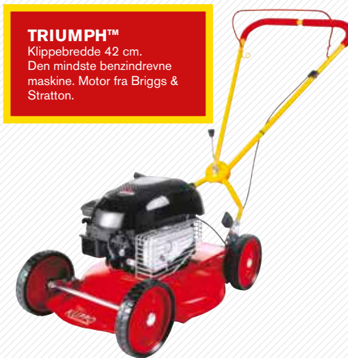
TRIUMPH™ Klippebredde 42 cm. Den mindste benzindrevne maskine. Motor fra Briggs & Stratton.

Tænk også på, at garantierne og produktansvaret kun gælder, hvis du bruger originale reservedele fra Klippo. Et tip: For bedst mulig klipping bør du udskifte kniven hvert år.