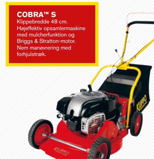
COBRA™ S Klippebredde 48 cm. Højeffektiv opsamlersmaskine med mulcherfunktion og Briggs & Stratton-motor. Nem manøvrering med forhjulstræk.