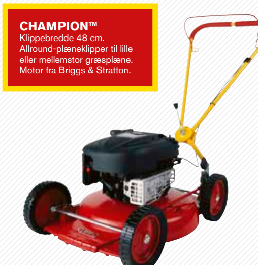
CHAMPION™ Klippebredde 48 cm. Allround-plæneklipper til lille eller mellemstor græsplæne. Motor fra Briggs & Stratton.