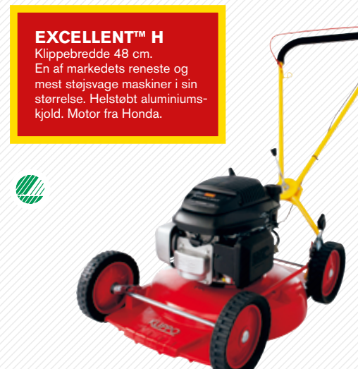
EXCELLENT™ H Klippebredde 48 cm. En af markedets reneste og mest støjsvage maskiner i sin størrelse. Helstøbt aluminiumskjold. Motor fra Honda.