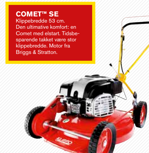
COMET™ SE Klippebredde 53 cm. Den ultimative komfort: en Comet med elstart. Tidsbesparende takket være stor klippebredde. Motor fra Briggs & Stratton.