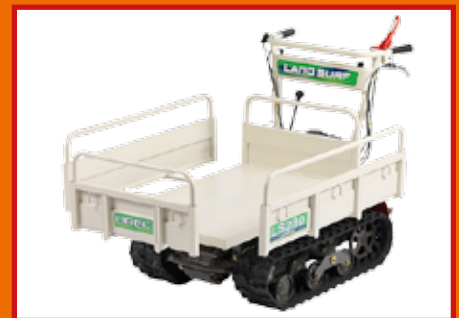
LS280 / LS360

Il motore del modello LS280 è montato direttamente all'interno del telaio. Il transporter LS280 ha inoltre di serie parafrangente, guida cingolo e manubrio regolabile su 2 posizioni.